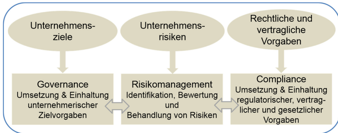
Abbildung 1: GRC – Governance, Risk & Compliance